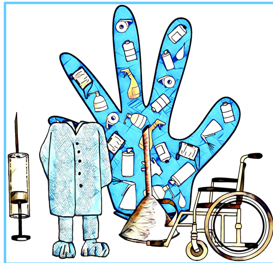
Illustration : Didier Dubuis