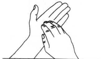
6 Ongles Désinfection des ongles