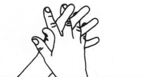
3 Doigts entrelacés Désinfection des espaces interdigitaux et des doigts